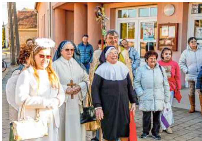
A vidám és bolondos nárai násznép

NÁRAI Mivel idén farsangig egyetlen házasság sem volt a településen, két év kihagyás után ismét volt rönkhúzás a faluban.