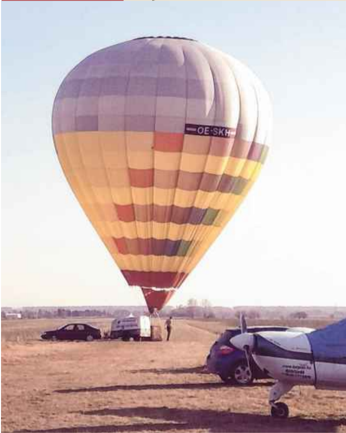
Bükkföldnél kapta lencsevégre kollégánk vasárnap délután ezt az óriási hőlégballont, amely hamarosan vidáman ringatózó léggömbbé változik: vágyakozva nézhetünk utána. Vajon hova száll a könnyű, szép tavaszban? A madarak nyomában?