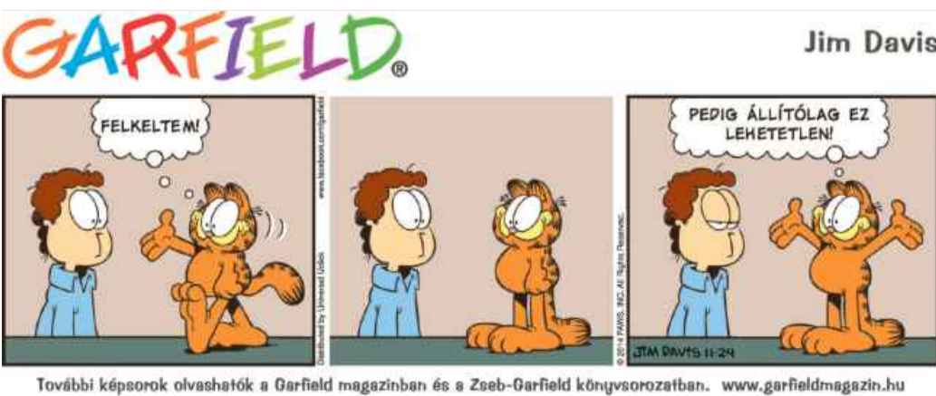
További képsorok olvashatók a Garfield magazinban és a Zseb-Garfield könyvsorozatban. www.garfieldmagazin.hu

BUDAPEST A Szerencsejáték Zrt. tájékoztatása szerint a 7. héten megtartott lottósorsolásokon az alábbi számokat húzták ki. Skandináv lottó Gépi sorsolás: 1 5 8 9 25 26 31 Kézi sorsolás: 4 5 7 18 23 24 34 Ötös lottó 37 38 58 59 68 Joker 630 350 Hatos lottó 6 15 34 35 39 44 EuroJackpot 1 24 30 31 47 7 9 A Skandináv lottón 7 találatos szelvény nem volt. A 6 találatos szelvényért 311 945; az 5 találatosokra 5980; a 4 találatosokra pedig 1235 forintot fizetnek. Az ötös lottón 5 találatos szelvény nem volt; a 4 találatosokra 2 787 525; a 3 találatosokra 31 110, a 2 találatosokra 1775 forintot fizetnek. A hatos lottón 6 találatos szelvény nem volt; az 5 találatosokra 469 315; a 4 találatosokra 9620; a 3 találatosokra 1990 forintot fizetnek. Az EuroJackpoton 5+2 és 5+1 találatos szelvény nem volt Magyarországon. Az 5+0 találatért 82 412 135, a 4+2 találatért 1 772 295, a 4+1 találatért 85 080, a 4+0 találatért 39 910, a 3+2 találatért 22 020, a 2+2 találatért 7340, a 3+1 találatért 6125, a 3+0 találatért 5230, az 1+2 találatért 3210, a 2+1 találatért 2485 forintot fizetnek. A héten várható bruttó nyereményösszeg: 6 milliárd Ft.